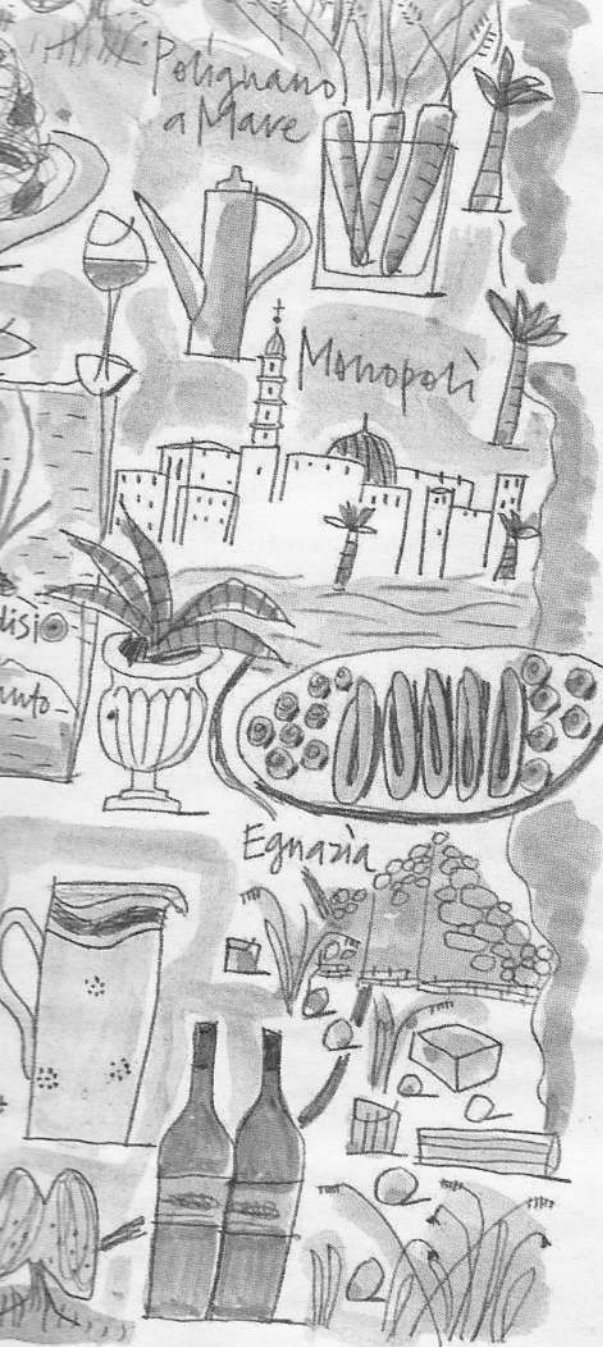
ILLUSTRAZIONE DI JULIA BIENFIELD